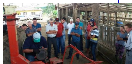
Grupo observa instruções