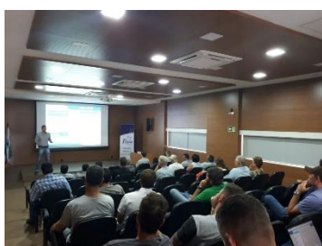
Reunião Comercial em Tibagi

O novo formato das Reuniões Comerciais aconteceu na matriz e nas unidades de Tibagi, Teixeira Soares e Ibituva, com assuntos e serviços importantes ao dia a dia do cooperado. Além da análise do mercado realizada pela área Comercial, também foram apresentadas as novas funcionalidades do aplicativo Frisia (confira mais na página 4), a importância da inscrição no Cadastro Ambiental Rural – CAR e a possibilidade de manejo integrado de pragas e doenças nas lavouras – MIP e MID.