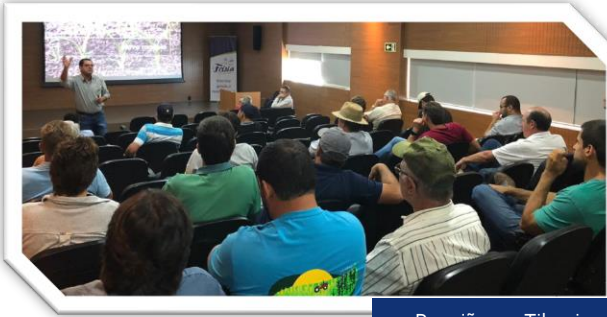
Reunião em Tibagi