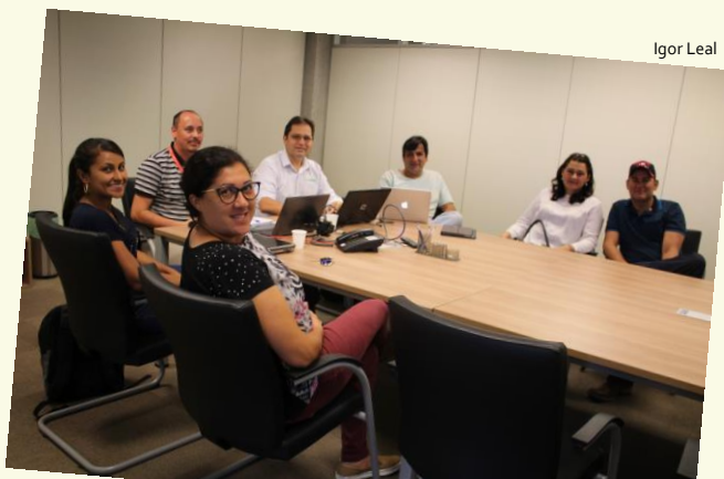
A Frisia está promovendo treinamentos do Agriwin